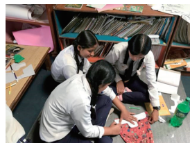
月経衛生管理について学び、女性の月経のしくみを学んだり布ナプキンなどを作成します