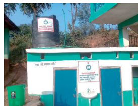
トイレなどの衛生設備を、年齢、障害、男女などに優しい状態に改善します