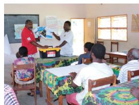
防災・減災の教材を開発、カリキュラムに組み込みます