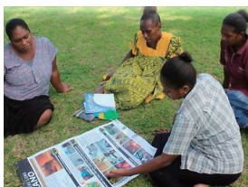
国の教師養成学校において、防災減災ツールを開発、活用します