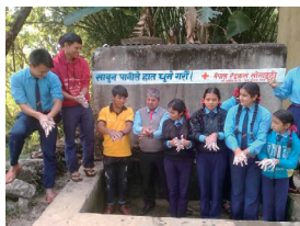
石鹸での手洗い方法を学びます